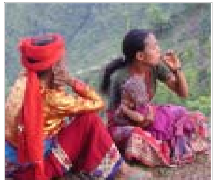
धूम्रपान स्वास्थ्यका लागि हानिकारक छ : काखमा रहेको बच्चाको ख्यालै नराखी चुरोट पिएर आनन्द लिदै जोगीमारा-७, पिपलडाँडाकी एक महिला ।

विद्यालयमा विभिन्न अतिरिक्त क्रियाकलापहरु संचालन गर्नको लागि चारओटा उपसमितिहरुको गठन पनि गरिएको छ । यसरी गठन गरिएका उपसमितिरुमा भित्तेपत्रिका प्रकाशन उपसमिति, नाटक उपसमिति, अतिरिक्त क्रियाकलाप उपसमिति र पुस्तकालय उपसमिति रहेका छन् ।